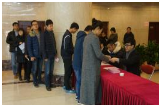
(上接第三版)近万人的选民投票工作。

自9月20日起，在朝阳区选举委员会酒仙桥地区分会的指导下，区人大换届选举工作有条不紊地全面展开。首先，召开了第63选区选举区人大代表专题工作部署会，对本选区的换届选举工作进行了全面的安排部署。其次，在实施选举工作中，工作组全体人员严格按照选举任务和安排，投入到各阶段工作中。通过张贴公告、悬挂横幅等方式对此次换届选举进行了广泛的宣传。同时，做好选民调查摸底、单位划分、代表名额分配等各项准备工作，积极动员广大选民进行登记。尤其11月15日为选民选举投票日，集团作为第63选区的主会场，于当日安排了20多名工作人员配合现场工作。为确保选举工作顺利进行，工作组严格选举程序，采取了划分时间段安排各单位按时间段组织