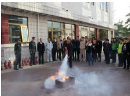
为切实加强园区安全教育工作，提高广大客户和职工的消防安全意识及自救防范水平，实业公司计划今年下半年组织三次园区客户及职工进

行年度消防疏散演习活动，涉及园区所有入住企业。近日，进行了第三次消防演习，在本次演习前，实业公司针对以往演习中存在的模拟起火点不足、宣传教育力度不足等问题，积极听取和采纳了客户建议，制订了周密详实的演习计划及应急预案，并在客户区内进行了广泛的宣传和动员，为演习的顺利完成奠定了良好的基础。