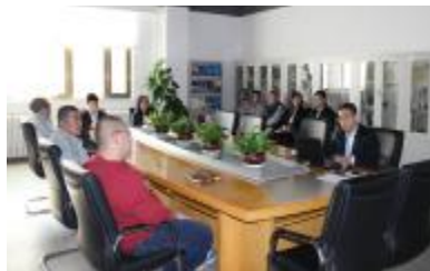
为进一步宣贯企业文化理念，提高新员工同企业共成长、同命运的使命感和责任心，确保实业

文化外化于形，内化于心，固化于制。12月15日，2016年实业公司新员工企业文化宣讲会于B2楼三层会议室正式开讲。